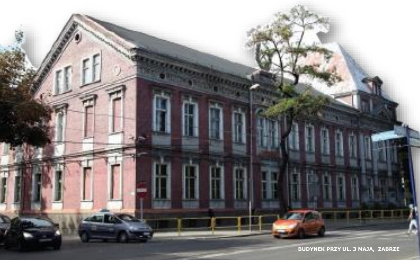
BUDYNEK PRZY UL. 3 MAJA, ZABRZE

Program Operacyjny Infrastruktura i Środowisko na lata 2014-2020 PRIORYTET: VIII Ochrona dziedzictwa kulturowego i rozwój zasobów kultury, DZIAŁANIE: 8.1 Ochrona dziedzictwa kulturowego i rozwój zasobów kultury