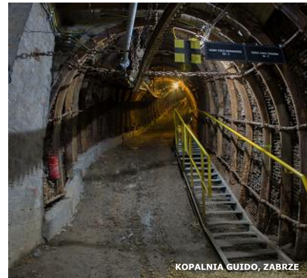
KOPALNIA GUIDO, ZABRZE