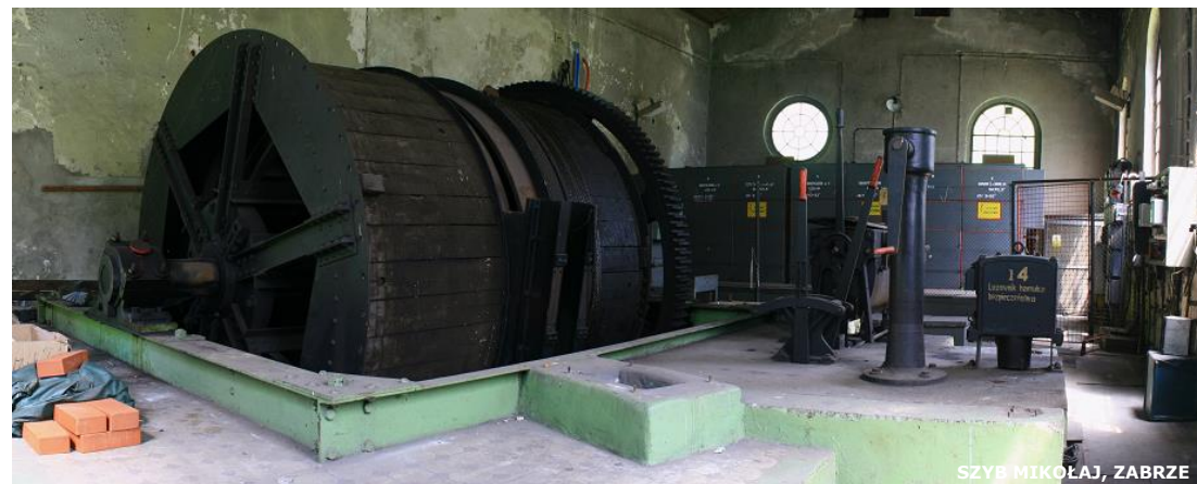
SZYB MIKOŁAJ, ZABRZE