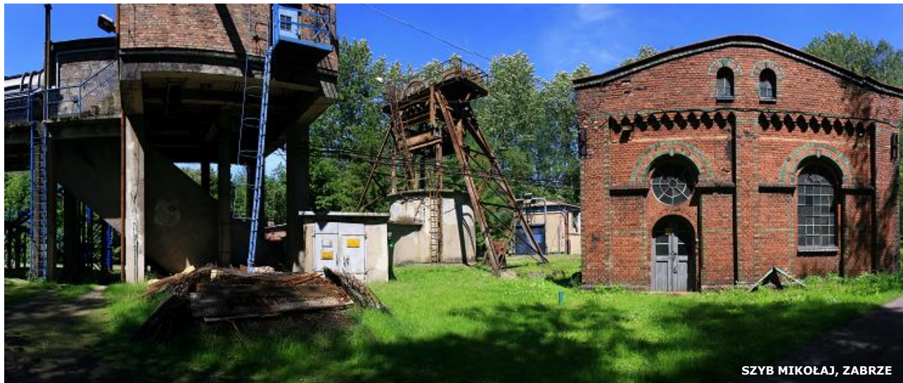
SZYB MIKOŁAJ, ZABRZE